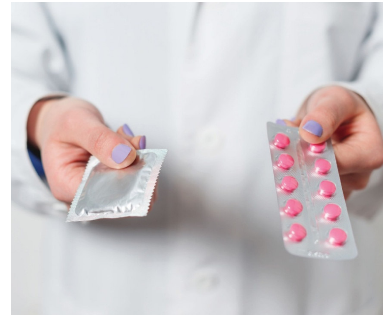
قبول هزینه های برای پیشگیری از بارداری

چنانچه سنوالاتی در باره تنظیم خانواده و پیشگیری از بارداری دارید لطفا به بخش مشاوره بارداری اینگولشتات مراجعه فرمایید: